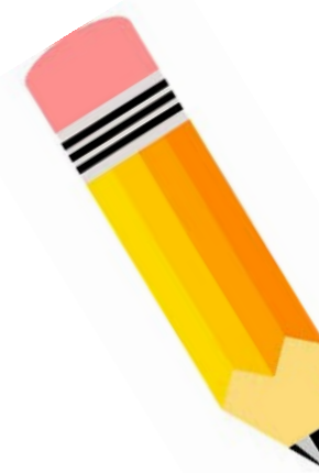
Elu on ilus!

*Kairega oleme sõbrad alates 7. eluaastast ning kirju kirjutame kogu tudengipõlve, mil üks elas ühes ning teine teises linnas. Peamiselt parandasime maailma ning arutlesime, kes mis etendust või näitust käis vaatamas.