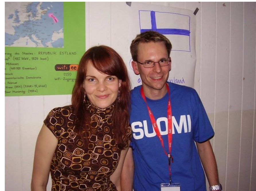
Merje vastleitud sõbraga.

sõprussuhted, mis said alguse Konstanzis. Need kohvikus, ühiselamus või ühistel õhtusöökidel ja pidudel veedetud hetked, kus oled rahvusvahelises seltskonnas ja naudid seda täielikult. Saksa keele õppimine oli ka meeldejääv, eriti, kui su keelegrupis on absoluutselt erineva aktsendiga inimesed - kujutage ette, kuidas räägib saksa keelt prantslane ja kuidas hiinlane ning saate ilmselt aru, mida ma mõtlen. Lisaks ülikoolile oli mul rõõm osa võtta ka kohapealse AIESECi haru tööst, tänu millele sain just sakslastega palju suhelda, neid tundma õppida. See oli eriline kogemus olla samas organisatsioonis nagu olin Eestis (AIESEC), ainult et hoopis teises keskkonnas. Vahva oli ka poliitilise protesti teemaline aine, mille raames läksime kogu kursusega öise rongiga Berliini, et küsitleda