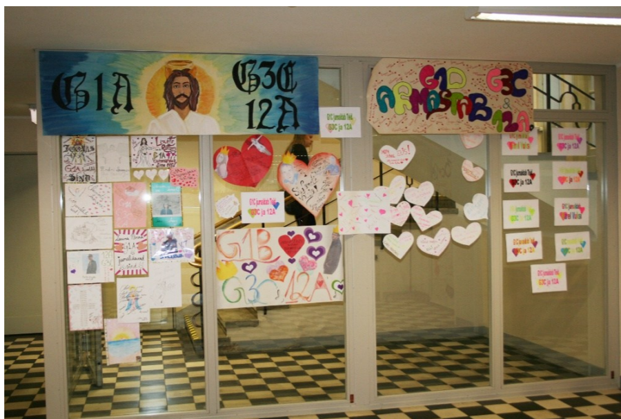
Jumalatele pühendatud altar, mille ees usklikud agaralt kummardasid..

kohata eestimeelseid noori rahvariites ning astudes paar sammu edasi, võis leida end keset hirmsate näomaalingutega kuulsaks saanud USA rokkbändi Kiss. Just erinevad stiilid muutsid päeva elamus-terohkemaks ka kõigile teistele, kes polnud ristimistega otseselt seotud.