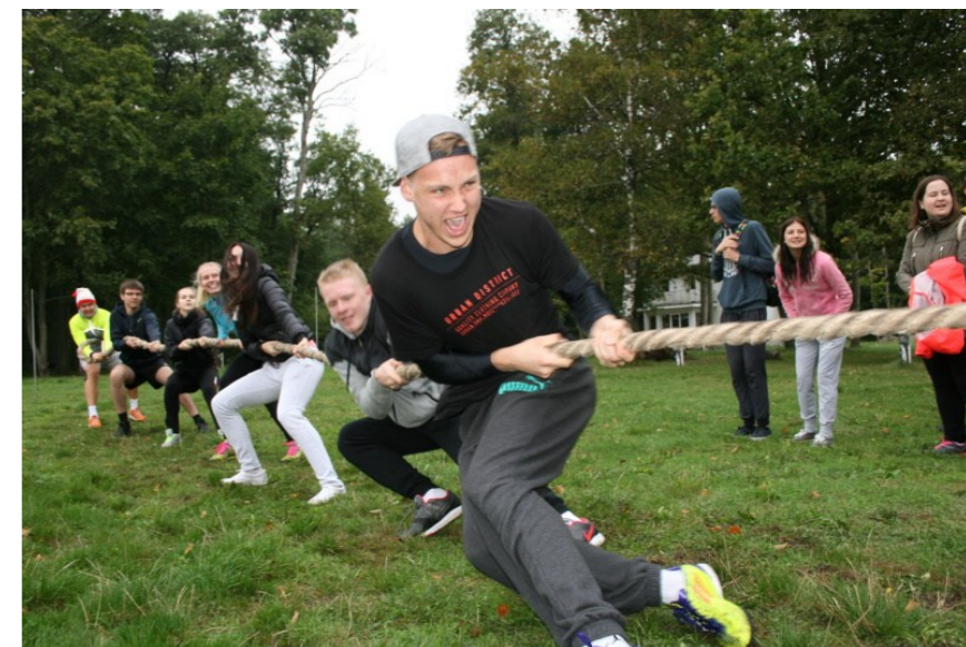
Kui see pole võidu nägu, siis ma ei tea, milline see välja peaks nägema.

klasside arvestuses oli 12a, G3b ja G3a. Üheteistkümnendikel vastavalt G2b, G2a ja G2e. Kümnendikest võitsid G1d õpilased.