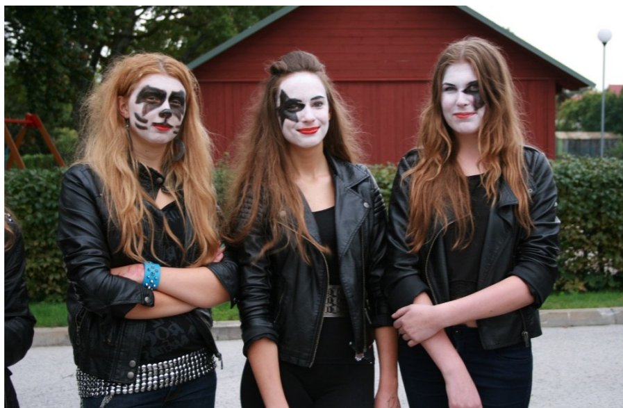
Heavy ei sure kunagi! Kiss? Kiss!

Rebaste päevad algasid kell 7.15 võimlemise, hommiku-söögi ja hambapesuga. Iga päev oli rebastele kohustuslikus tehtud mingi erineva riietusstiili kandmine. Näiteks neljapäeval pidi B klass end riietama Jamaica reggae-lauljaks Bob Marley'ks ja reedel pidi D klass kehastuma kartmatuteks härjavõitlejateks. Rebaste võtsid stiilimuutustest usinalt osa ning kool nägi välja kui teater, kus ühes koridoris võis