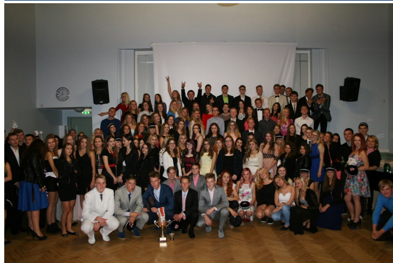
Kõik võitsid midagi

Ristimise üheks põhie-eesmärgiks võib pidada ka klassi ühendamist ja sõprussuhete arendamist, mis õnnestus tänu mängudele väga hästi. Rebaste ja jumalad olid ühisel arvamusel, et ristimise traditsioon peaks püsima ning et see on nende jaoks tähtis. „Mina isiklikult tunnen küll, et