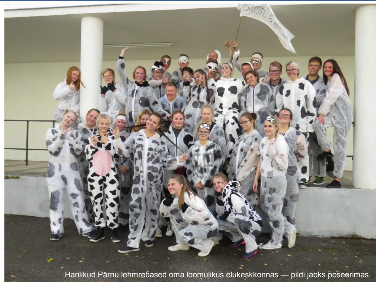
Harilikud Pärnu lehmrebased oma loomulikus elukeskkonnas — pildi jaoks poseerimas.

Reede hommikul kogunesid kooli ette hoopis müstilised nõiad, haldjad, libahundid ja vampiirid, kes